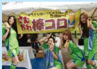
写真は5/13「寒川町民デー」