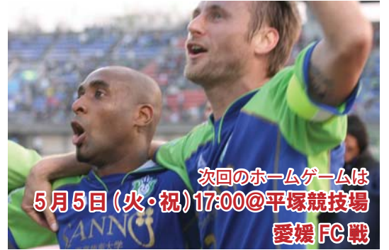
次回のホームゲームは 5月5日(火・祝) 17:00 @ 平塚競技場 愛媛FC戦