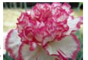
自分へのプレゼントにも!