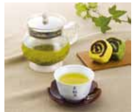
お菓子は異なります

ほかに園内の田んぼを使った「田んぼで春発見ゲーム」(自由参加)、懐かしのおもちゃや草を使った遊び「昭和のおもちゃ・懐かしの草遊び」などの催しがあります。