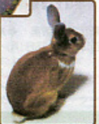
おまの子(4才) おまの子サザ おまの子に合ったハッピー はねが広がってささて くれませぬ(笑) ハッピーちゃん