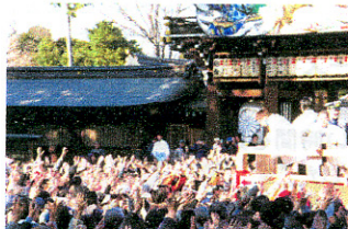
*写真は2008年度の節分祭のもの。

寒川神社御本殿では、邪気災厄を除けようと、午前・午後の二度に分け約300人の男男、年女が「福は内、鬼は外」と唱えながら豆撒き神事を行います。 開催日・2009年2月3日(火) 時間・11:00/14:00の2回 会場・節分祭…寒川神社 御本殿 豆撒き…寒川神社 神門前外庭、特設櫓上より お問い合わせ・寒川神社社務所 0467-75-0004 *諸事情により日程・時間・場所などが変更になる場合がありますので事前に会場・主催者までお問い合わせ下さい。