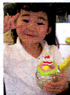
パン粘土 入門講座