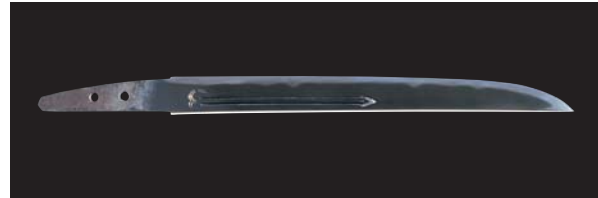
国宝 短刀 無銘 貞宗 (名物 寺沢貞宗) 一口 鎌倉時代末期～南北朝時代 14世紀 文化庁 【展示期間: 2/28～3/24】

信長、秀吉、家康の三天下人に仕えて時流を乗り切り、晩年を京で過ごした織田有楽齋の心中には、どのような思いがあったのでしょうか。本展覧会は、2021年に400年遠忌を迎えた織田有楽齋という人物を、いま一度総合的に捉えなおそうと構成したものです。