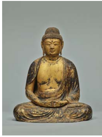
国宝 阿彌陀如来坐像 平安時代・12世紀 岩手・中尊寺金色院蔵

本展では、堂内中央の須弥壇に安置されている国宝の仏像 11 体を一堂に展示するほか、かつて金色堂を荘厳していた国宝・金銅迦陵頻伽文華鬘（こんどうかりょうびんがもんげまん）をはじめとするまばゆいばかりの工芸品の数々を紹介いたします。