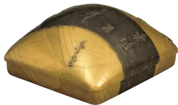
国宝 舟橋蒔絵硯箱 本阿弥光悦作 江戸時代・17世紀 東京国立博物館蔵

本展では、光悦自身の手による書や作陶にあらわれた内面世界と、同じ信仰のもとに参集した工匠たちがかわった蒔絵など同時代の社会状況に回答した造形とを結び付ける糸として、光悦とその一族が篤く信仰した当代の法華町衆の社会についても注目します。