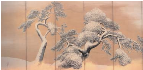
国宝 雪松図屏風(左隻) 円山応挙筆 江戸時代・18世紀 三井記念美術館蔵

三井記念美術館では年末年始恒例の国宝「雪松図屏風」を展示。また、今回は能面と能の意匠をテーマとし、三井記念美術館が所蔵する能面・能装束のほか、能にまつわる茶道具なども展示。能の儼かな雰囲気とともに、華やかで美しい色やデザイン、作品の中に広がる豊かな能の世界をお楽しみください。