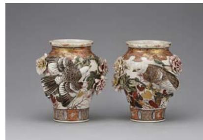
宮川香山(初代)高浮彫薔薇鳩花瓶、 明治時代前期~中期(19世紀後半)、 各24.5 x 22.8 cm、横山美術館蔵

本展は、輸出陶磁器の全盛期である明治時代前半に海外へ輸出された日本各地の陶磁器の里帰り品を皮切りに、明治30年代以降のアール・ヌーヴォー、アール・デコに代表される新しい意匠(デザイン)を取り入れた作品を、公益財団法人横山美術館の名品約140点によりご紹介するものです。