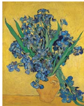
フィンセント・ファン・ゴッホ 《アイリス》1890年 油彩/キャンバス ファン・ゴッホ美術館、 アムステルダム(フィンセント・ ファン・ゴッホ財団) Van Gogh Museum, Amsterdam(Vincent van Gogh Foundation)

*チケット利用時は、チケットの但し書きをよくお読みいただき、各施設の開館や入場制限をご確認の上お出かけください。