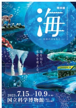
特別展「海」メインビジュアル

私たちの身近にある「海」の誕生から現在について、多様な生物や人と海の関わりを紹介し、さらには海との未来を考えていく特別展を開催しています。