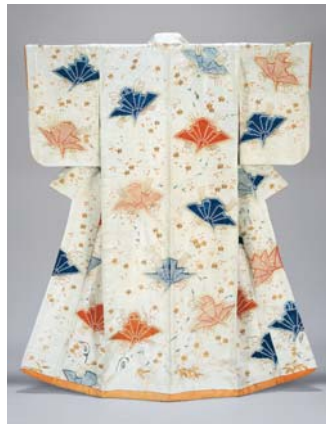
白紬子地梅に熨斗蝶模様打掛 一領 江戸時代 19世紀 サントリー美術館 【展示期間：8/23～9/18】

日本美術の特色のひとつとして、草木花鳥が古来大事にされてきたことが挙げられます。そして、それらと比較すると小さな存在ではあるものの、虫もまた重要なモチーフでした。そこで、本展では特に江戸時代に焦点をあて、中世や近現代の「虫めづる日本の人々」の様相に触れつつ、虫と人との親密な関係を改めて見つめ直します。