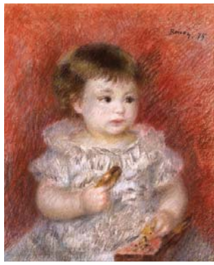
ピエール＝オーギュスト・ルノワール 《リュシアン・ドーデの肖像》 1879年 8月15日より展示

松岡清次郎は東洋陶磁蒐集のため欧米のオークションに参加するうちに、印象派やエコール・ド・パリなど西洋画にも興味を抱き、コレクションを築きました。今回は松岡美術館所蔵の西洋画コレクションの中から、清次郎が晩年に蒐集したモネ、ルノワールをはじめとする、フランス印象派・新印象派の絵画を一堂に会します。