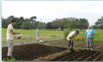
種まき作業（畝づくり）

今年8年目となる「さむかわ冬のひまわり」事業。11月下旬の開花に向けて、いよいよ本格始動するにあたり、農作業をしてくださるボランティアを募集します。炎天下の草取り、農具を使った種まきなど作業は決して楽ではありませんが、寒川の広い空の下、相模川からの川風に吹かれながら汗を流すのはなかなか爽快です。気持ちの良い汗を流し、11月下旬には満開のかわいいひまわりを思い切り楽しみませんか？